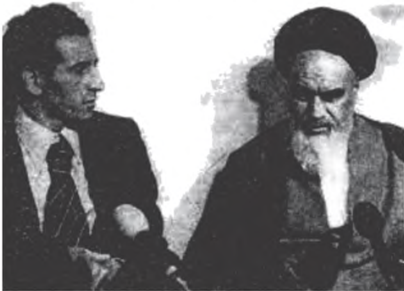
عبد السلام جلود والمرشد الأعلى للثورة الإيرانية الإمام روح الله الخميني أثناء زيارته لإيران، 1979.